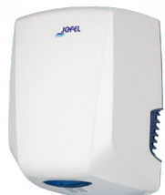
AA56000 8427950367342 Finition blanche