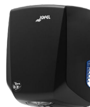
AA56600-MT 8427950367427 Finition noire mate