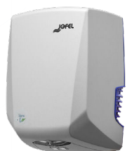
AA56300 8427950367380 Finition argent