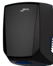
AA56600 8427950367427 Finition noire